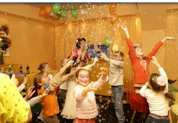
Центры семейной анимации