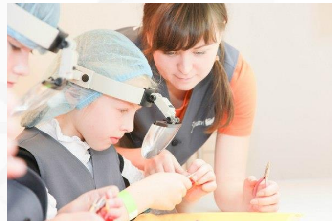
Экспериментариум, Кидбург, Марс-Тефо