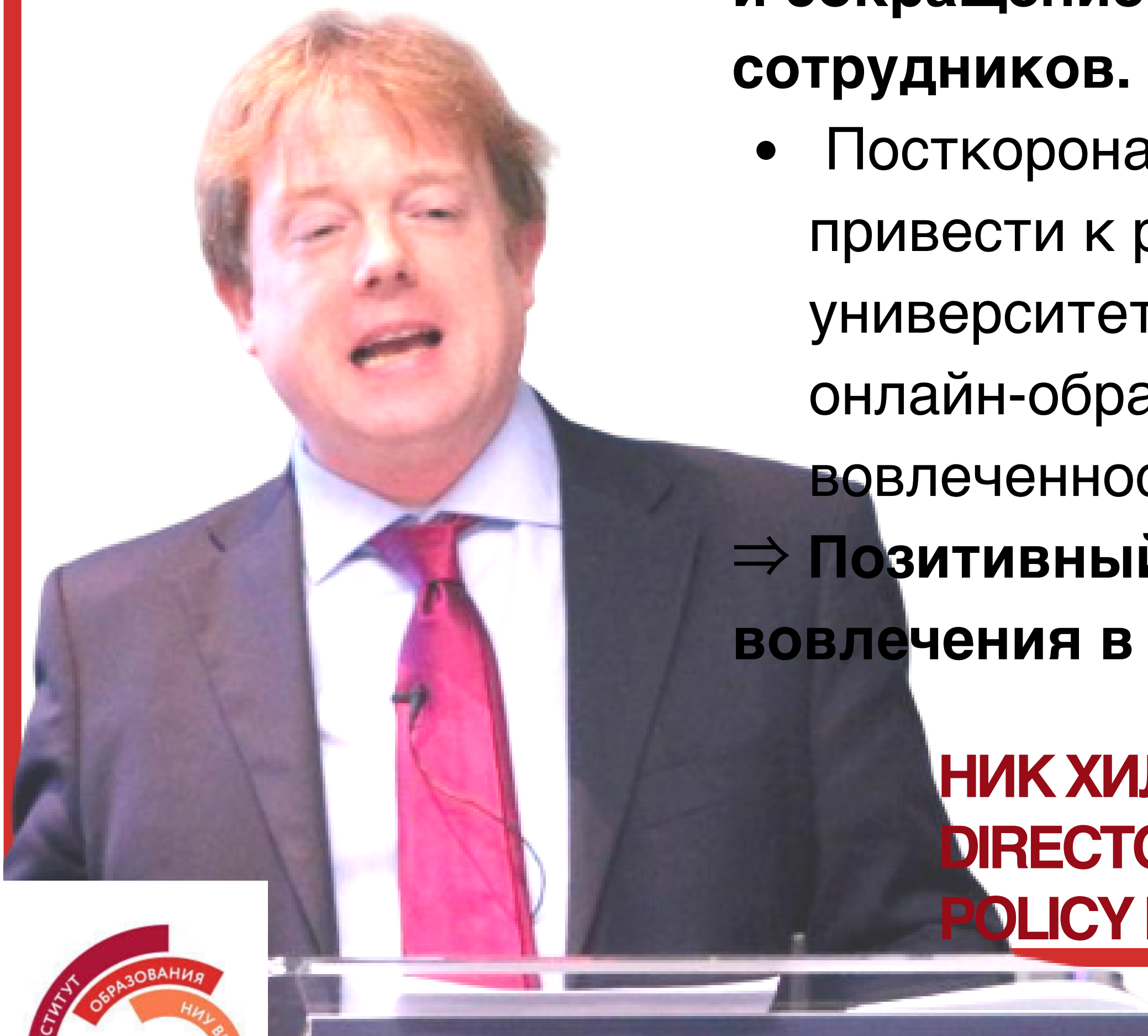
НИК ХИЛМАН, DIRECTOR OF THE HIGHER EDUCATION POLICY INSTITUTE