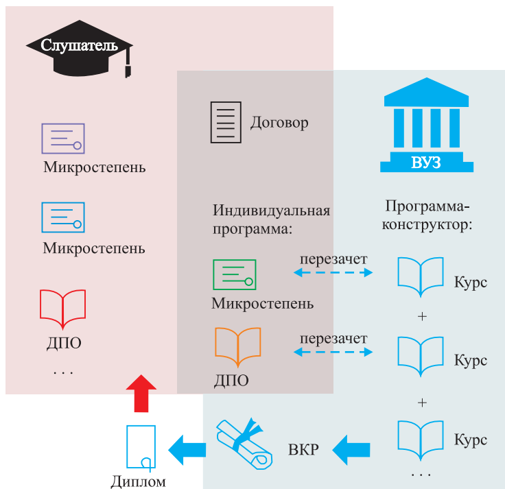
Рис. 2. Образовательная программа — конструктор

2. Университет разрабатывает образовательную программу — конструктор (требования к набору микростепеней, которые позволят слушателю прикрепиться к университету для защиты ВКР и получения диплома). Если слушатель соблюдает установленные условия и набирает соответствующее количество микростепеней, он может заключить с университетом договор и претендовать на получение диплома магистратуры (рис. 2).