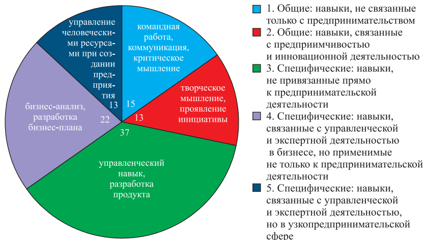
Рис. 3. Количественное распределение навыков для всех проанализированных курсов с примерами (бакалавриат+магистратура), %