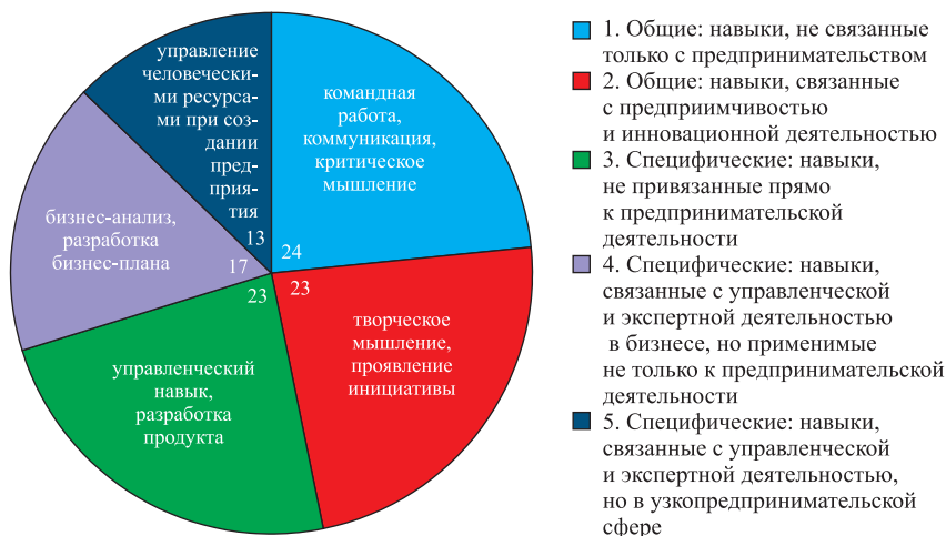
Рис. 5. Количественное распределение навыков для всех проанализированных курсов и программ в магистратуре (с примерами), %