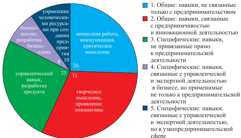
Рис. 2. Количественное распределение навыков для всех проанализированных программ (с примерами) (бакалавриат+магистратура), %