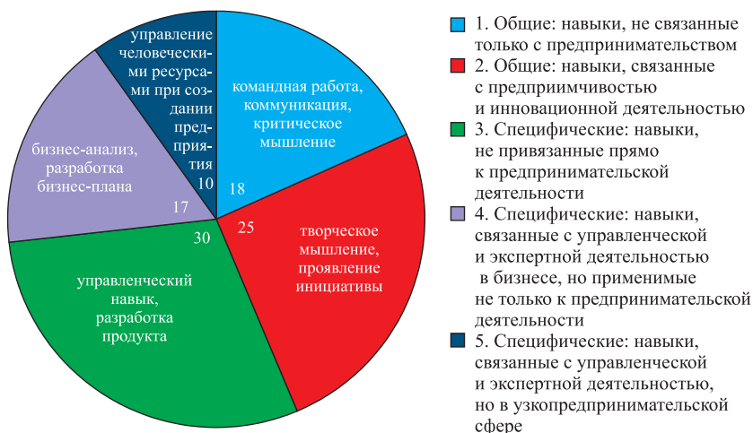
Рис. 1. Количественное распределение выявленных навыков (с примерами) для всей проанализированной выборки курсов и программ, %