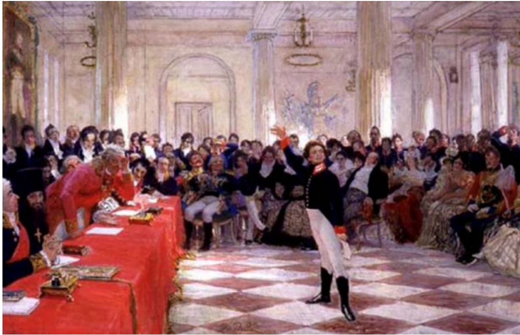
И.Е. Репин "Пушкин на лицейском экзамене в Царском Селе 8 января 1815 года", 1911