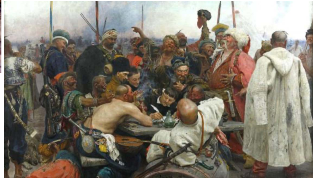
И.Е. Репин «Запорожцы», 1880-1881