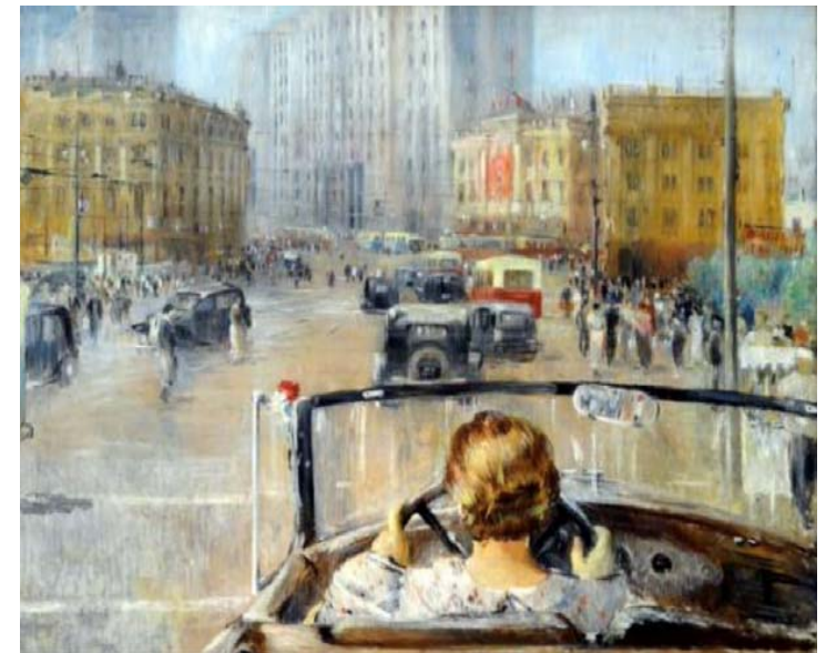
Ю.И. Пименов «Новая Москва», 1937

Чем различаются города, сельские поселения? Какие функции они выполняют? К какому типу относится город, в котором вы живете? Почему?