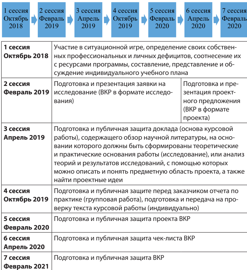
Рисунок 3. Динамика разворачивания магистерской образовательной программы «Управление образованием» (когорты 2018–21)

они представляются заказчику, реализуются на его базе при участии разработчика. Итоги работы публично обсуждаются 18 .