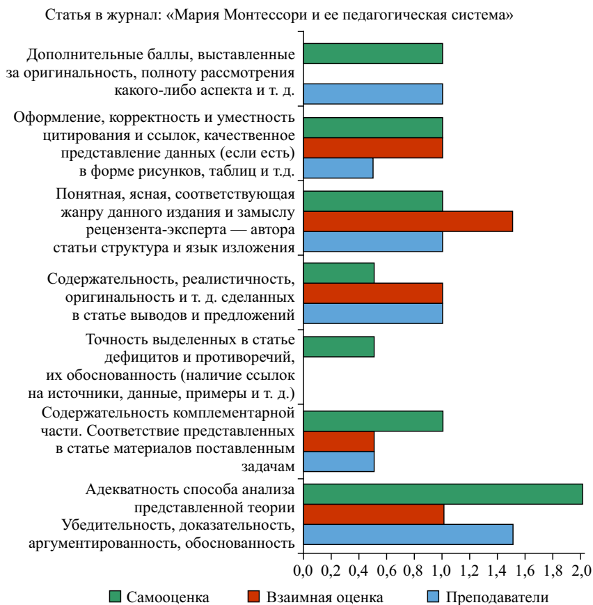
Рисунок 4. Диаграмма оценок статьи в журнал по критериям