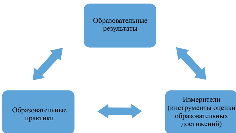
Рисунок 1. Схематическое изображение образовательной программы

и со стандартом профессиональной деятельности (руководителя образовательной организации в данном случае), и с оригинальным стандартом НИУ ВШЭ по направлению «Государственное и муниципальное управление». Первый стандарт выражен «линейкой»: обобщенная трудовая функция — трудовая функция — трудовое действие; второй — через компетенции. Если трудовые действия легко переводятся в набор проверяемых результатов, то соотнесение последних с компетенциями не самая тривиальная задача.