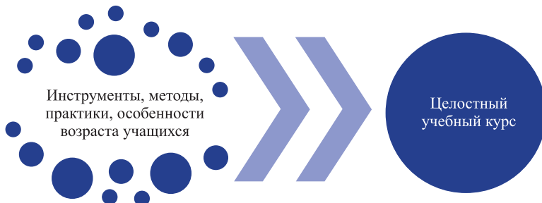
Рис. 4. Схема общего конструктора курса «Дизайн учебных курсов»