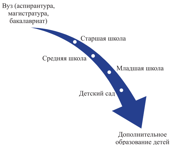
Рис. 1. Смысловая последовательность формирования тематики лекций на курсе «Современное образование: подходы и практики»

• задания в курсе — как мини-проекты от заказчиков (конкретных образовательных проектов, образовательных организаций, педагогических практик).