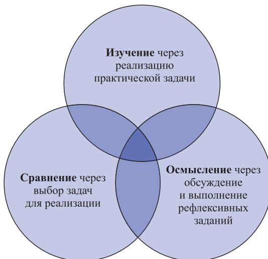
Рис. 2. Базовые задачи курса «Лучшие практики преподавания»